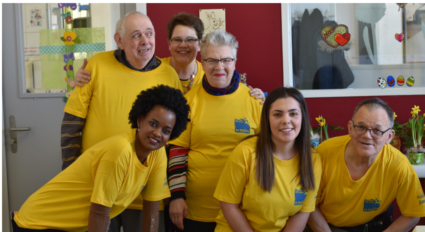
La joyeuse équipe du centre de jour

Il n'est pas facile de montrer ce qui se passe dans un centre de jour, lorsque l'on est retraité. On joue aux cartes, on se promène, on fait la sieste ? Pour montrer notre vie de retraité active, nous avons opté pour un petit marché, avec des produits artisanaux que nous avons confectionnés au long de l'année. La visite de la Rosière se faisait en suivant un circuit et, par nos produits faits maison, nous nous démarquions beaucoup de ce qui se fait habituellement dans notre institution. Que de monde partout. C'était même un peu stressant, de montrer, vendre, répondre aux questions. Par contre, le monde a répondu encore mieux que prévu à nos attentes, et c'était une grande satisfaction de se sentir encore utiles et capables. Notre petit coin cinéma a été également bien apprécié.