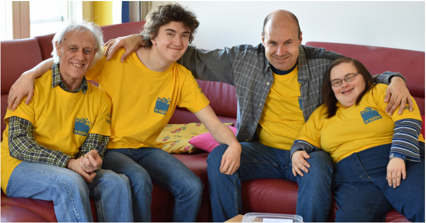
Les groupes 1 et 2 du foyer symbolisés par 4 jolis sourires

d'une soupe aux légumes et de croissants au saumon. Chacun s'est réjoui de faire découvrir aux visiteurs son lieu de vie.